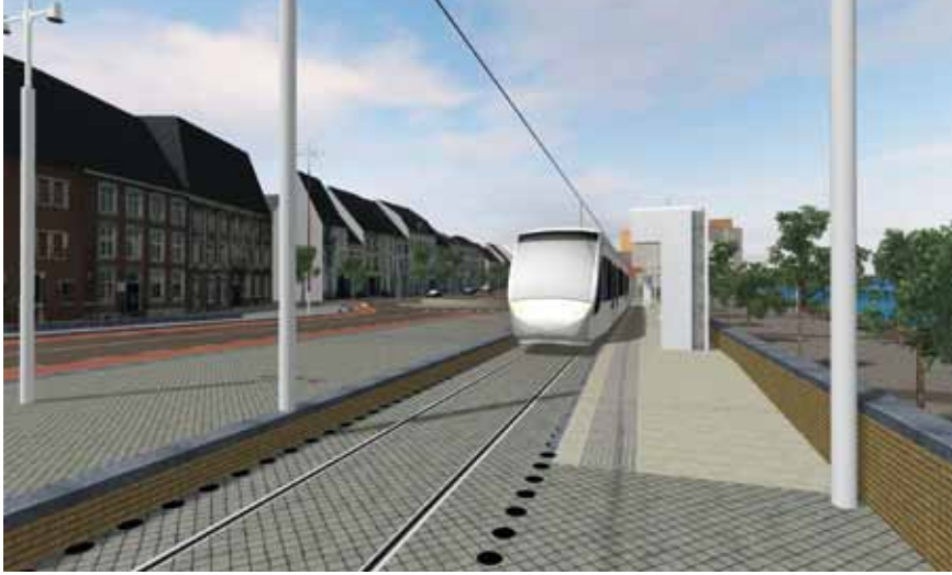
Animatie van de halte Maasboulevard, kijkend in noordelijke richting.

totale ov-gebruik binnen, van en naar de provincie Belgisch Limburg met 6,8 miljoen verplaatsingen per jaar. Dit komt neer op zo'n 20.000 verplaatsingen per dag. Een deel van deze verplaatsingen is grensoverschrijdend. Momenteel maken reizigers tussen Maastricht en Vlaanderen ongeveer een half miljoen busritten per jaar, zo'n 1500 per dag. De projectorganisatie Tram Vlaanderen-Maastricht verwacht na een ingroeiperiode 1,3 tot 2,3 miljoen reizigersritten van en naar Maastricht, zo'n 4000 tot 7000 ritten per dag.