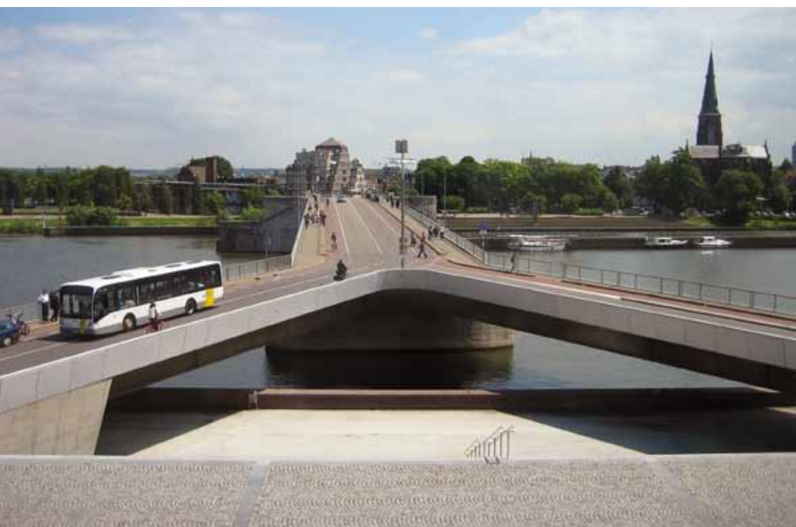
De tram rijdt vanaf het stationsplein over de Wilhelminabrug naar de westoever van Maastricht.

GASTAUTEUR RIK LÉBOUILLE (GEMEENTE MAASTRICHT)