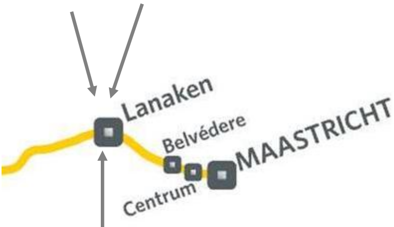
Principe van het visgraatmodel: bussen rijden vanuit het omliggende gebied naar een tramhalte, reizigers stappen over op de tram voor de verbinding met Maastricht en Hasselt

Buiten de beide hier genoemde ontwikkelingen lijkt er voor het overige geen aanleiding te zijn om als gevolg van de komst van de tramverbinding Hasselt – Maastricht vanuit vervoerkundige optiek aanpassingen in het Maastrichtse openbaar vervoernetwerk door te voeren.